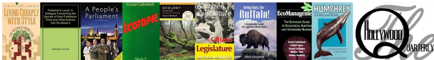
Figure très influente de l’écologie et de l’histoire naturelle, il est l’auteur de Ecology : A Pocket Guide et du roman phare Ecotopia . La perte est profonde pour nous tous à la Presse.

Dans son double rôle, il a exercé une influence majeure sur le développement de la culture cinématographique et de l’étude cinématographique aux États-Unis et ailleurs.