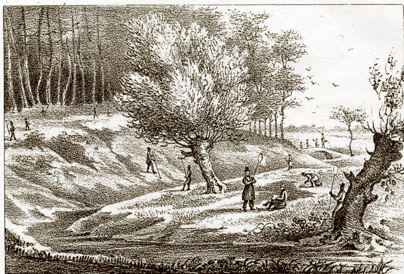
Vue de la partie de la plaine d'Arlac où fut fondée la fête Saint-Jean le 25 Juin 1818.

Mais nous nous sommes un peu perdus dans ce passé lointain. Revenons à une époque plus récente.