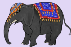
Dessin: Noa Roux

Ce mausolée est la 7 em e merveille du monde et est bâti sur les bords de la Yamuna à Agra en Inde. Il est parfaitement symétrique et change de couleur en fonction de la lumière.